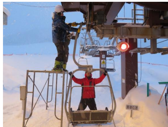
リフト定期整備（定期実施）の様子