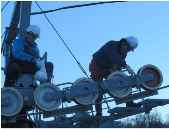
オープン前リフト検査（12ヶ月検査）の様子