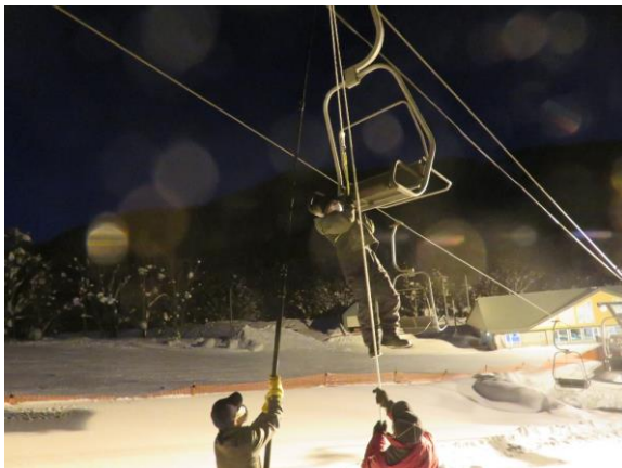
リフト救助訓練の様子