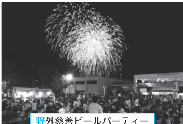
野外慈善ビールパーティー