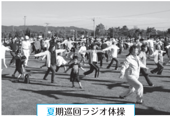
夏期巡回ラジオ体操