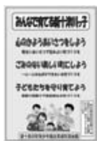
▲青少年健全育成啓発ポスター

自動車に「パトロール中」シートの貼付、各事業所などでの啓発ポスターの掲示をお願いし、日常的な防犯活動や青少年の健全育成に努めています。