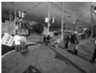
▲子どもの安全を見守る立哨指導

春先の下校時安全指導と同じく、今回も多くの関係団体の皆さんのご協力により実施しました。2日間で延べ84人の参加をいただき、通学路要所にて見守りやあいさつを通して子どもたちとの交流を深めました。