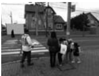
▲新1年生への下校時安全指導

日時 平成27年4月8日(水)、9日(木) 場所 小学校通学路 老人クラブ連合会、女性団体連絡協議会、安全・安心推進協会、民生委員の会の皆さんと共に、新1年生の命をしっかりと守る交通安全指導を行いました。