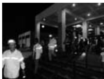
▲5班編成で会場周辺巡視へ順次出動

日時 平成27年7月25日(土) 場所 会場周辺 安全・安心推進協会の皆さんと共に、そろいの帽子と腕章を身に付け総勢36人、雨混じりの中、精力的に巡視を行いました。