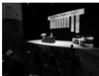
▲思いを伝える児童生徒の作文発表

夢、希望、願いをテーマに、小中学生8人と新十津川農業高校生による作文発表などが行われました。発表者の思いが伝わる素晴らしい内容と発表でした。