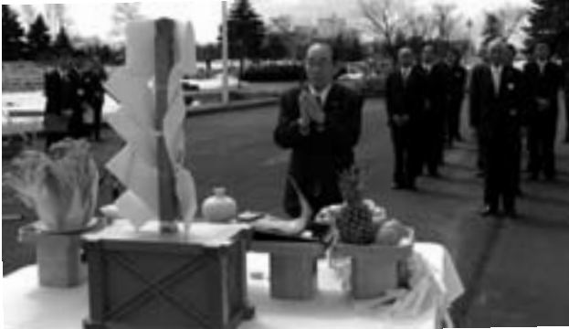
ふるさと公園安全祈願祭 (4・27)