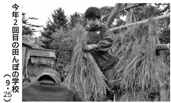
今年2回目の田んぼの学校 (9・25)

保健福祉課 ☎72-2000 建設課 ☎76-2139 住民課 ☎76-2130 議会事務局 ☎76-3191 総務課 ☎76-2131 会計課 ☎76-3192 産業振興課 ☎76-2134 教育委員会 ☎76-4233 農業委員会 ☎76-2135