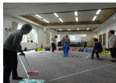
【ファイターズ リアル野球盤】